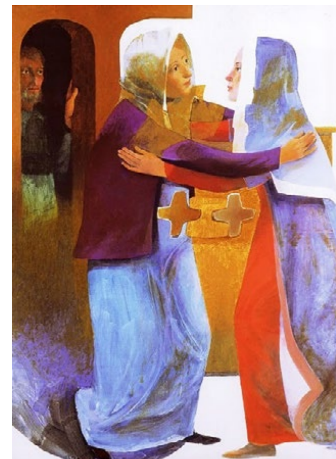
Visitazione – Arcabas - 1970