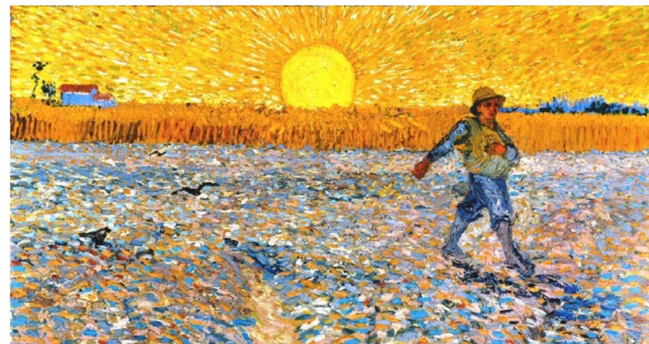
Il seminatore – Van Gogh - 1888.