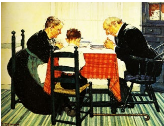
Thanksgiving - Norman Rockwell - 1938