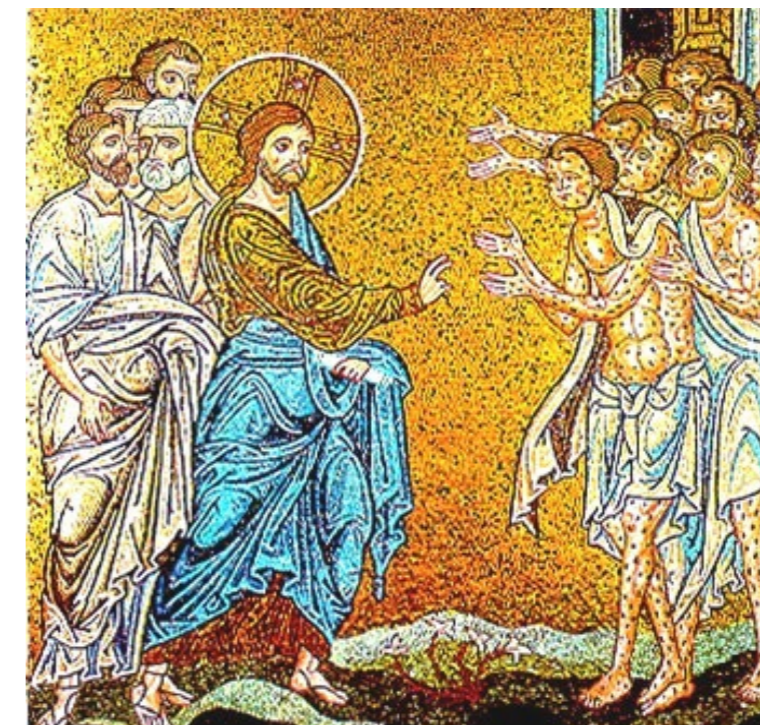
«Non ne sono stati purificati dieci? E gli altri nove dove sono? Non si è trovato nessuno che tornasse indietro a rendere gloria a Dio, all'infuori di questo straniero?» (Lc 17,11-18) – Mosaico del XIII secolo a Monreale