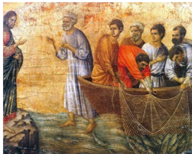
Apparizione del Risorto ai discepoli sul lago di Tiberiade - Duccio di Buoninsegna - 1308