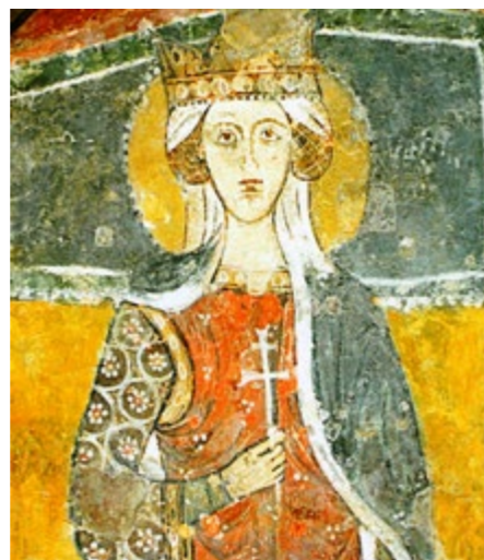
S.Margherita di Antiochia, XIII secolo - Chiesa rupestre di S.Margherita, Melfi