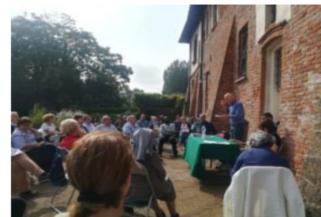
Incontro del 18 settembre 2021 con i Consigli Pastoralisti delle due parrocchie alla Certosa di Vigano Certosino