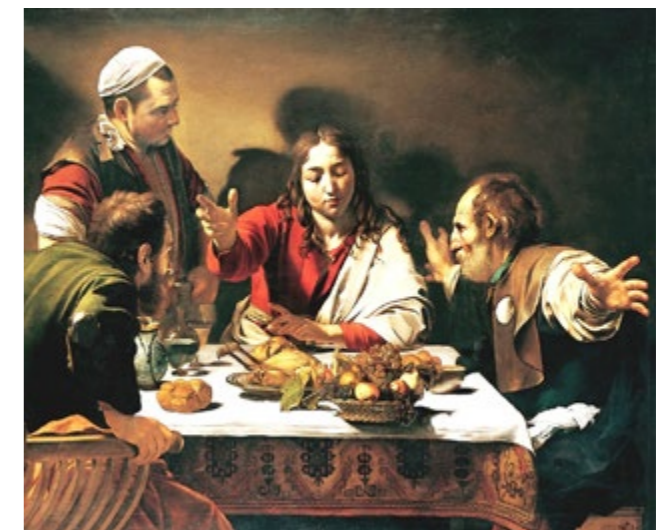
Cena in Emmaus - Caravaggio - 1601