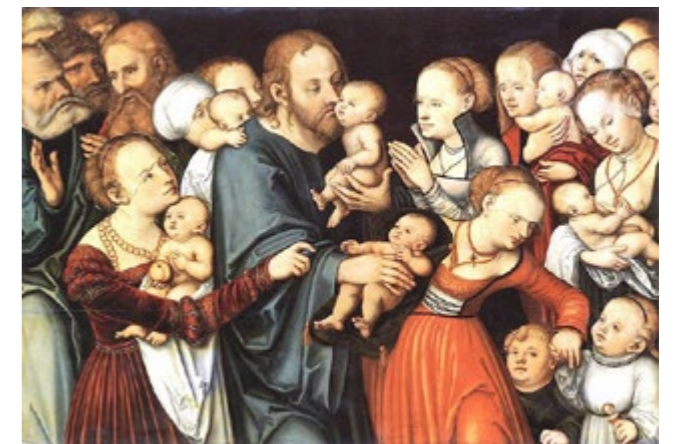
Lucas Cranach il vecchio - 1535

Laura e Giulia (catechiste dell'Iniziazione Cristiana)