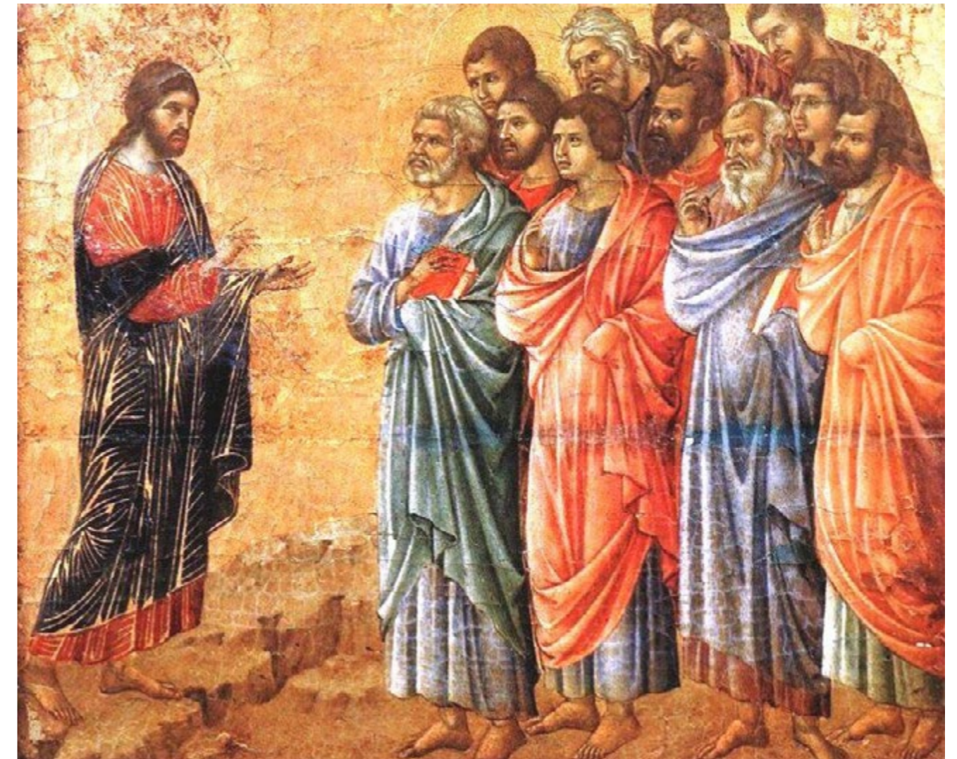
"Andate in tutto il mondo e proclamate il Vangelo a ogni creatura" – Duccio di Buoninsegna - 1311

1 Roberto Repole, Il dono dell'annuncio , Ed. San Paolo 2021