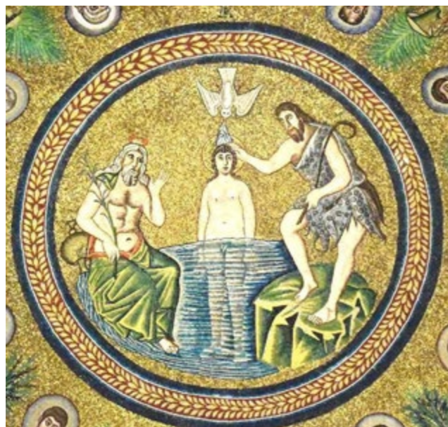
Battesimo di Gesù – Mosaico del V secolo - Ravenna

Secondo. La Pasqua è sensibilmente collegata al Battesimo perché tale sacramento, tramite l'immersione nell'acqua, rende partecipi della morte di Cristo per riemergere con lui come nuove