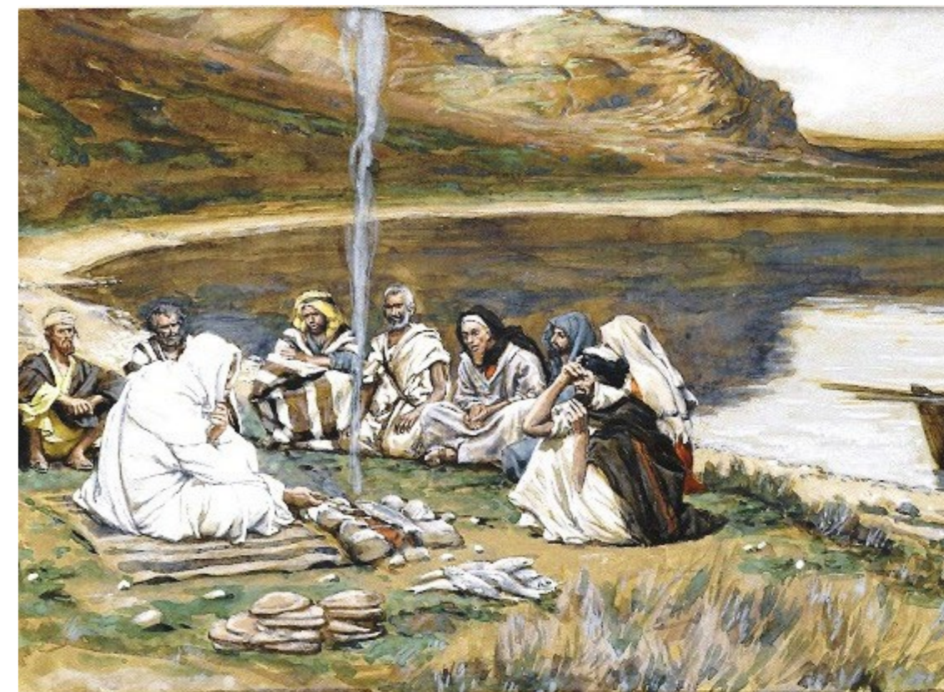
Gesù cena con i discepoli al lago di Tiberiade - James Tissot - 1886-